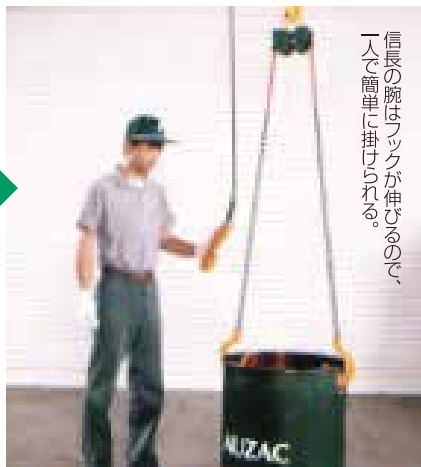
信長の腕はフックが伸びるので、一人で簡単に掛けられる。