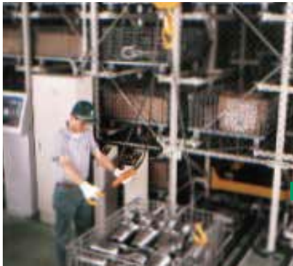
従来製品では片方を掛けると、片方が掛からない。