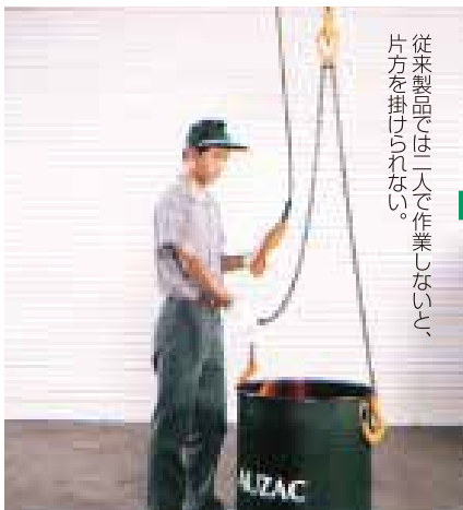
従来製品では二人で作業しないと、片方を掛けられない。