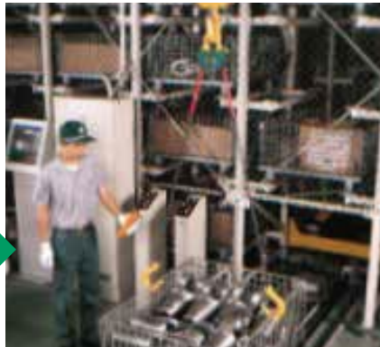
信長の腕は、片手でシッカリと簡単に掛かる。